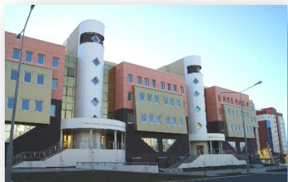
Политехнический институт, г. Мирный