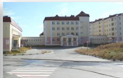
Чукотский филиал, г. Анадырь