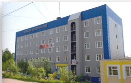
Технический институт, г. Нерюнгри