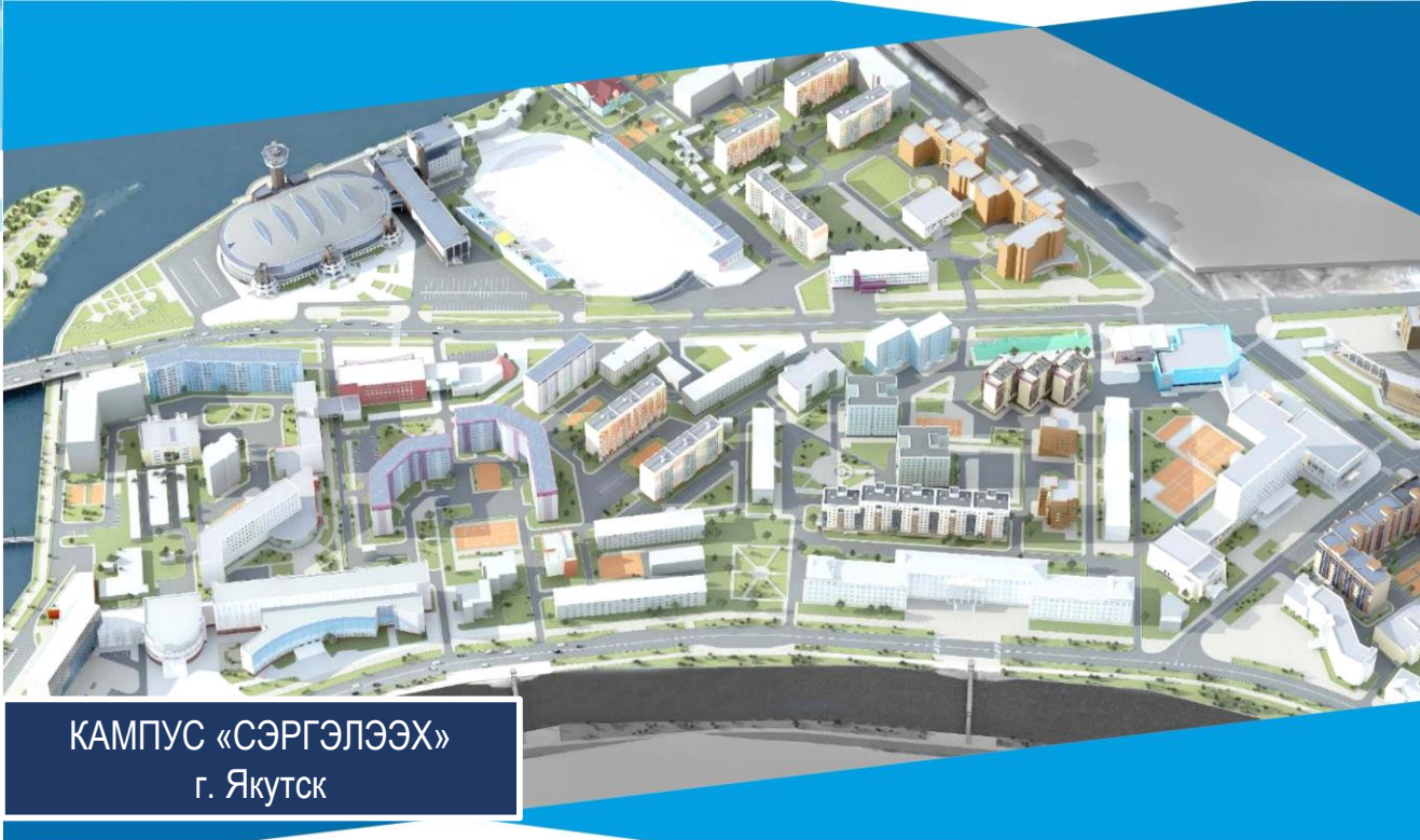
КАМПУС «СЭРГЭЛЭЭХ» г. Якутск